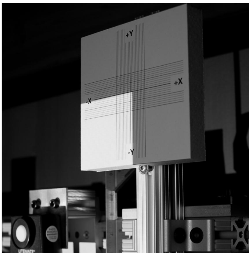
Skutečná fotografie přípravku s fokální rovinou

Další informace naleznete na webových stránkách: